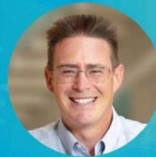
Rob Knight 加州大學聖地牙哥分校 教授